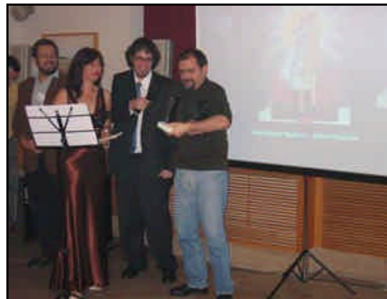
Ignotus; mejor tebeo