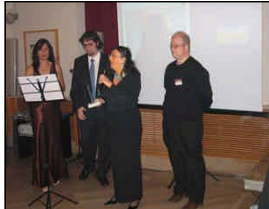
Ignotus; mejor sitio web