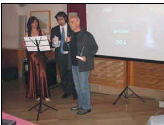
Ignotus; mejor novela