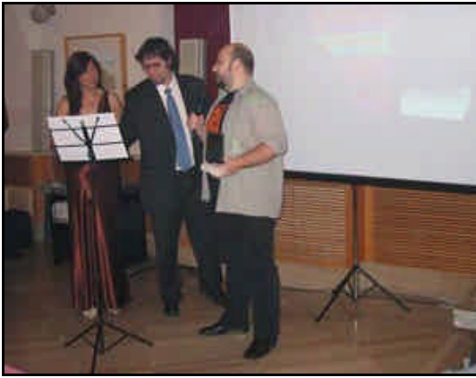
Ignotus; mejor obra poética