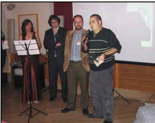
Ignotus; mejor revista