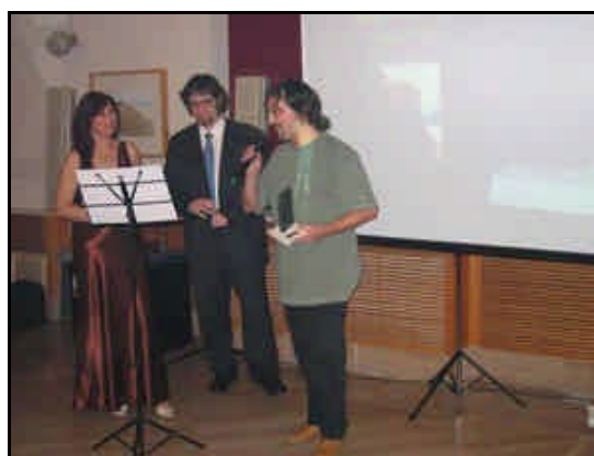
Ignotus; mejor novela extranjera