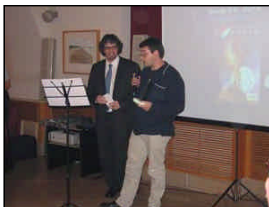
Ignotus; cuento extranjero