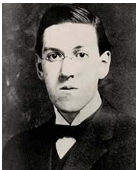
H. P. Lovecraft

desde la humildad. Lovecraft creó todo un mundo de monstruos cuyo poder iba más allá del entendimiento humano, y para ello tuvo la idea de conocer bien los avances científicos de su época y usarlos como contraste de su mundo. Es normal leer descripciones en relatos de Lovecraft que aluden a la naturaleza no euclidiana de los lugares que aparecen en ellos, o a la forma medio animal, medio planta de sus criaturas. A menudo estas descripciones las hacen gente que entiende de la materia que hablan, como matemáticos o biólogos. Y no es necesario que seas matemático o biólogo para convencer al lector de ello, sólo tienes que parecerlo, y él hará el resto, pensará que si el personaje lo considera raro y entiende de ello, entonces él debe considerarlo raro también. Lovecraft no era matemático, pero cuando escribió Los sueños de la casa de la bruja logró convencerme, a mí matemático, no sólo de que el protagonista lo era, sino de que había de verdad logrado encontrar un portal a la cuarta dimensión. ¿Y cómo hizo eso? Desde luego no mediante descripciones absurdas y sin fundamento, como ocurre muchas veces cuando se habla de la cuarta dimensión en la ficción. Empezó a contar la teoría que el protagonista conocía, la geometría Riemanniana, sin entrar en muchos detalles, y luego relató lo inútil e incompleta que era comparada con lo que ese personaje había encontrado.