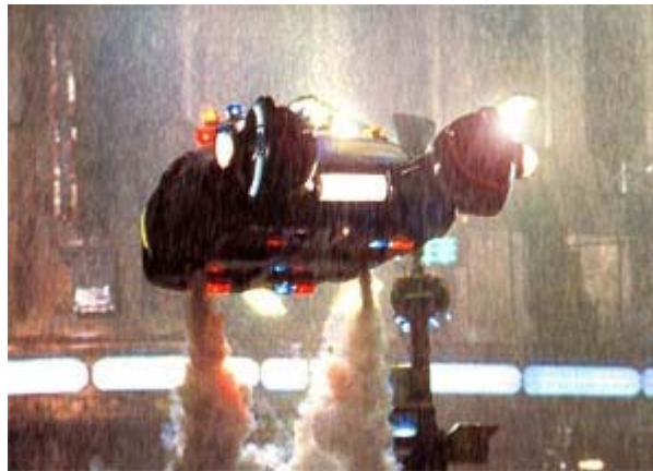
Blade Runner (1982)

No mucho después de su nacimiento, el cine inició el género de catástrofes. Una película inglesa de los años 30, Deluge , ya presentaba el planeta totalmente inundado por una serie de catástrofes naturales. Sin embargo, las películas centradas en tema de ecocatástrofes no llegarían hasta los años setenta, en particular con Naves misteriosas (1971). Un hermoso film sobre una nave en que se guardan las últimas plantas supervivientes, pero que peca de ingenuidad —el botánico al cargo tarda toda la película en captar que se le están muriendo por la falta de luz solar.